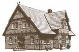
FACHWERKHAUS EH 210