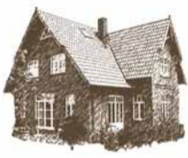
LANDHAUS EH 180