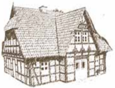
FACHWERKHAUS EH 170

weitere Häuser und Informationen unter www.der-spieker.de