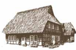
FACHWERKHAUS EH 430