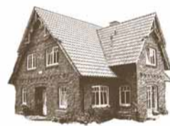
LANDHAUS EH 190