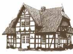
FACHWERKHAUS EH 140